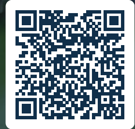
Rotina de trabalho em inglês